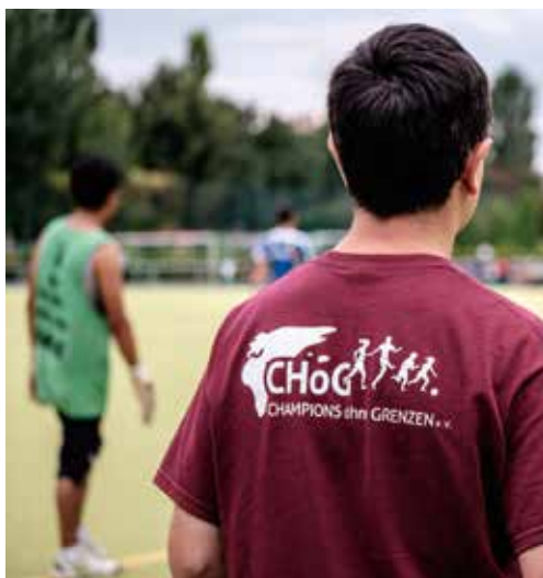
»Champions ohne Grenzen« ist eine Flüchtlingsmannschaft aus Berlin.