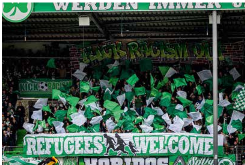
Die Fürther Fanszene organisierte im April 2015 eine Choreografie unter dem Motto »Kick Racism out – Refugees Welcome«.