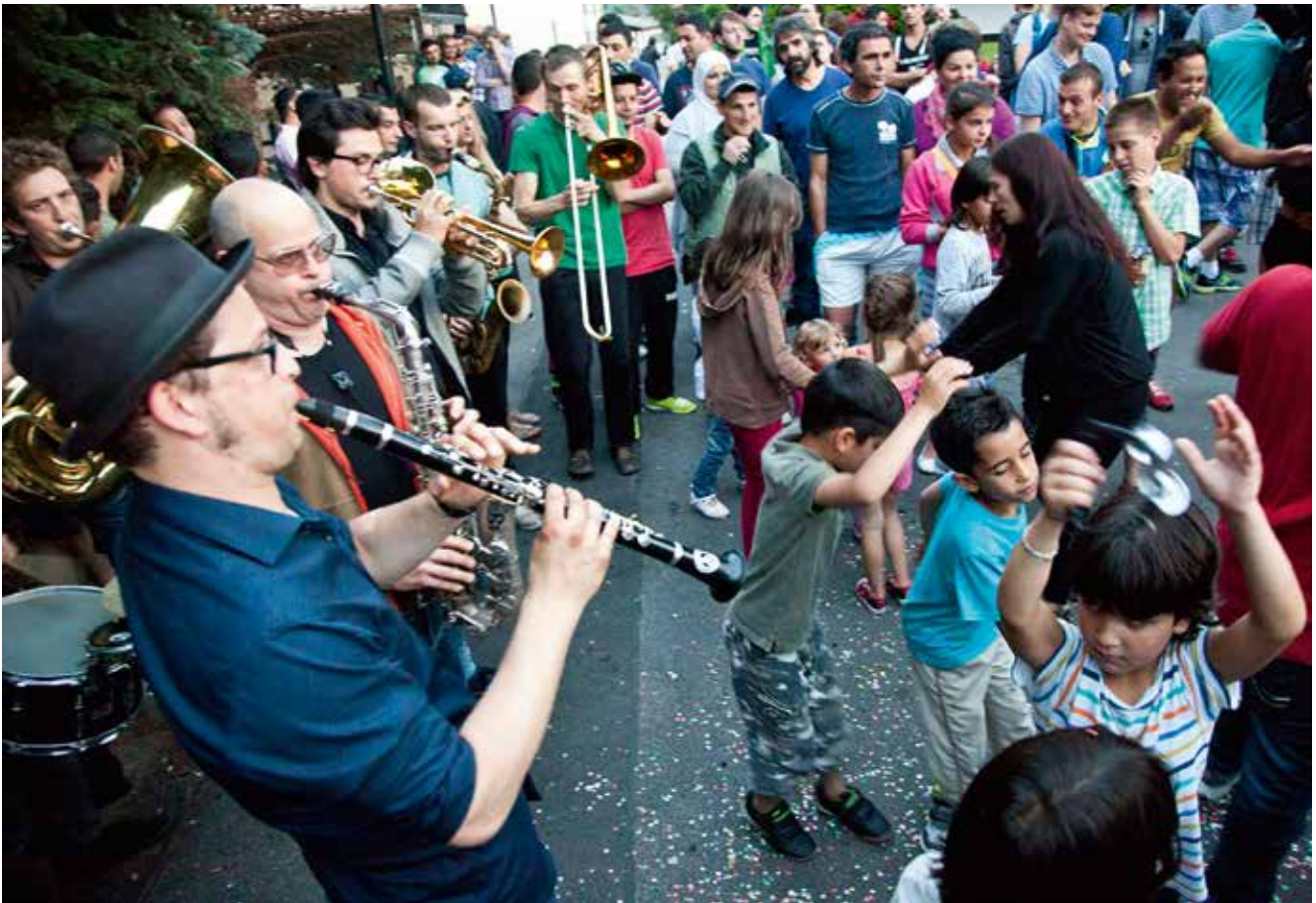
Die Banda Comunale spielt in Freital vor einer Flüchtlingsunterkunft.