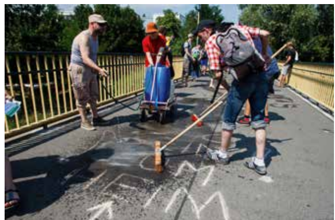
Freiwillige entfernen rassistische Parolen.

Der Begriff sexualisierte Gewalt umfasst sexuelle Handlungen, die gegen den Willen einer Person, also gegen ihre persönliche Freiheit durchgeführt werden. Sexualisierte Gewalt reicht von Anmache und sexuellen Belästigungen im Alltag bis hin zu Formen tätlicher Gewalt, wie aufgedrängten Berührungen und (versuchten oder vollendeten) Vergewaltigungen.