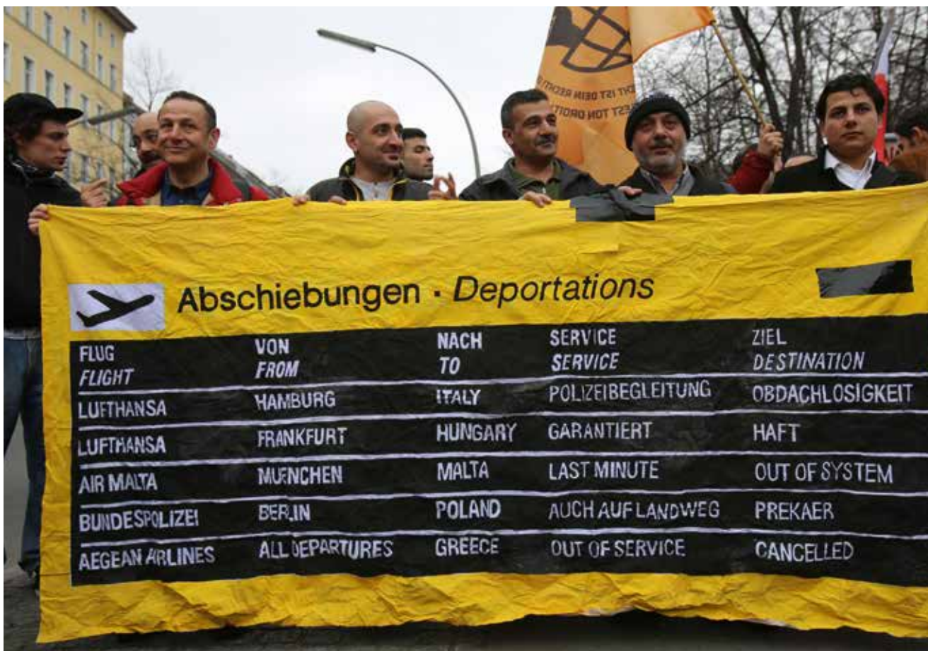
Geflüchtete protestieren gegen Abschiebungen auf einer Demonstration in Berlin.