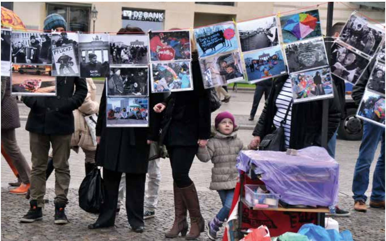
»Photographers in solidarity« unterstützen Geflüchtete im Kampf um ihre Rechte. Eine aus Solidarität mit den am Brandenburger Tor hungerstreikenden Refugees über Nacht verwirklichte Ausstellung wuchs innerhalb eines Monats zu beachtlicher Größe.