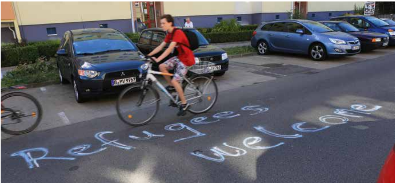
Refugees welcome – gegen Rassismus