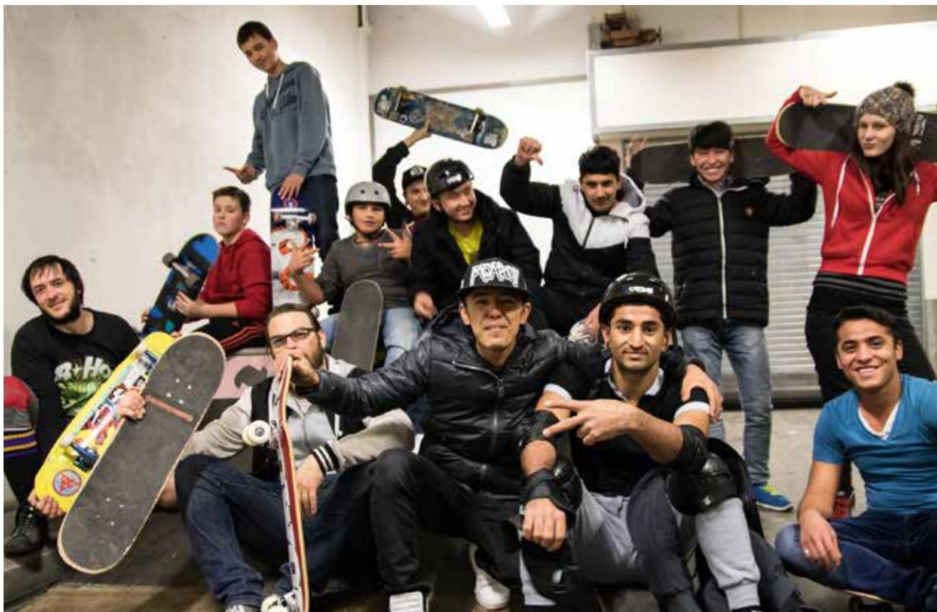
Skateprojekt: Gemeinsam skaten in Würzburg

Abgelehnte Asylsuchende müssen mit einer zwangsweisen Durchsetzung ihrer Ausreise rechnen, der Abschiebung. Die Termine für eine Abschiebung dürfen seit Herbst 2015 nicht mehr angekündigt werden, was für die Betroffenen eine ständige Unsicherheit und Angst bedeutet. Allerdings kann eine Abschiebung ausgesetzt werden, wenn sich z.B. ein Herkunftsland weigert, Reisedokumente auszustellen, oder die Menschen – ärztlich attestiert – reiseunfähig sind. Der Schutz vor Abschiebung von kranken Geflüchteten ist im Zuge des Asylpakets II 2016 jedoch gravierend eingeschränkt worden. Wird eine Abschiebung ausgesetzt, erhalten die betroffenen Flüchtlinge eine »Duldung«, die oftmals nur für kurze Zeiträume erteilt wird und immer wieder verlängert werden muss. Sie ist kein richtiger Aufenthaltstitel. Zu Beginn des Jahres 2015 lebten ca. 113.000 Geduldete in Deutschland, zum Teil schon viele Jahre. Für sie gelten ähnliche Rechte wie für Menschen im Asylverfahren. In Teilen sind sie jedoch noch schlechter gestellt.