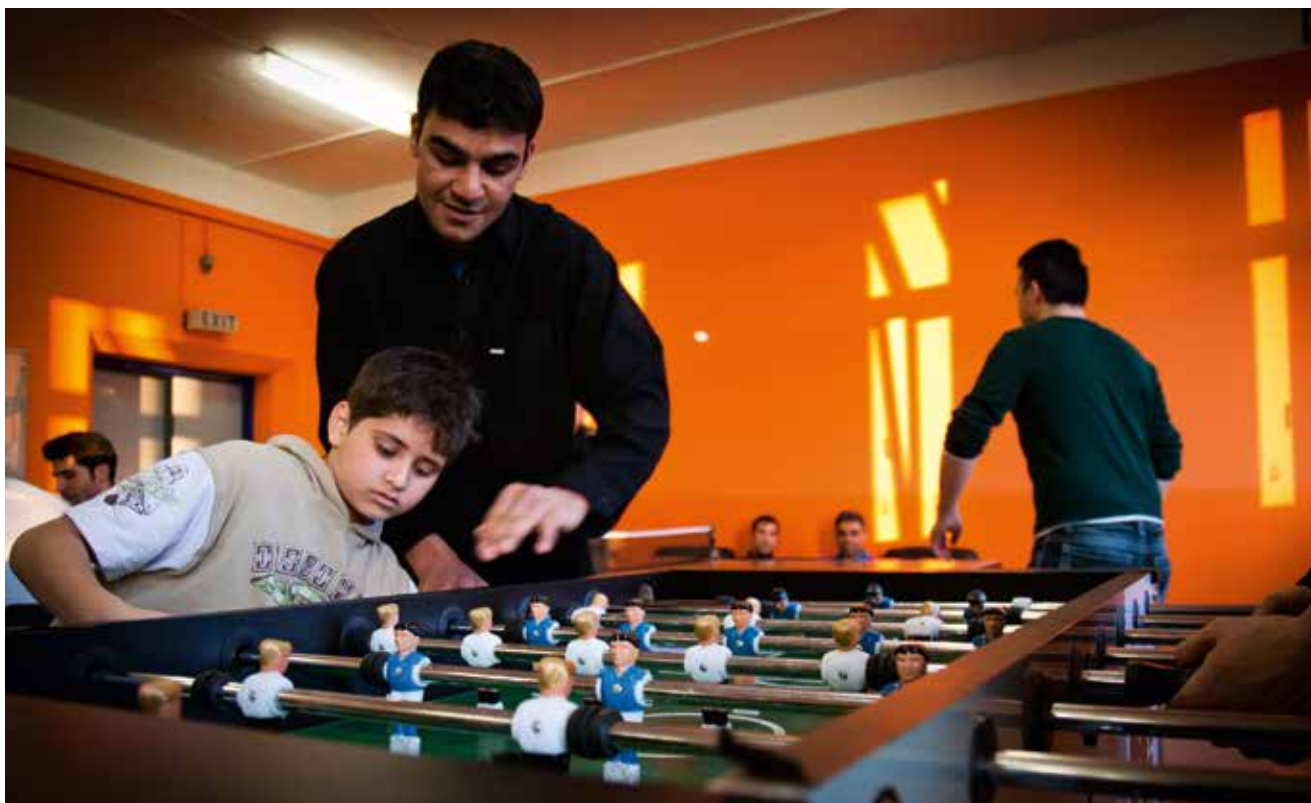
Gemeinsame Freizeitgestaltung ermöglicht soziale Kontakte zwischen Anwohner_innen und Asylsuchenden.