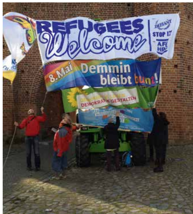
© Bündnis Vorpommern: weltoffen, demokratisch, bunt!