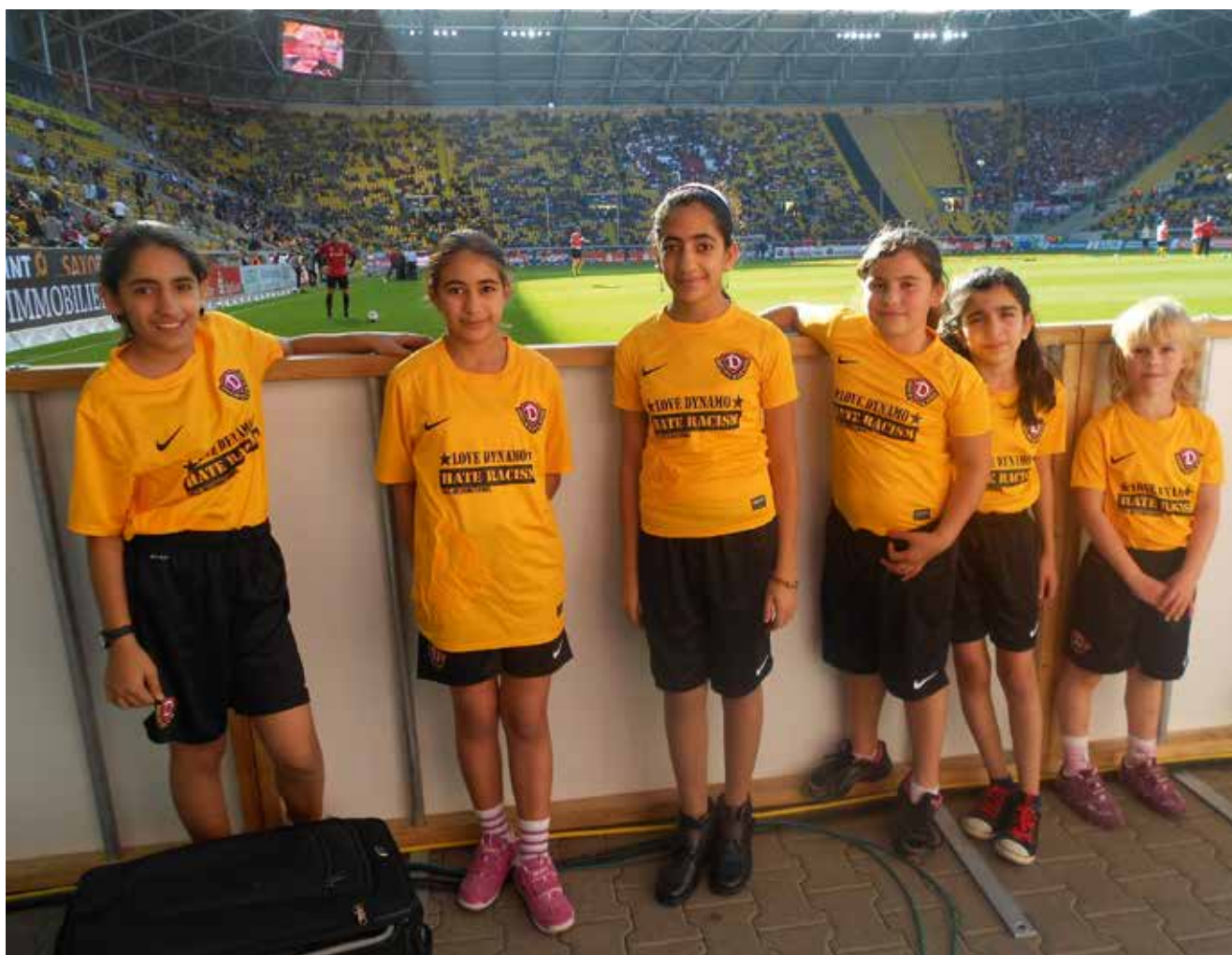
Die Faninitiative 1953international lädt gemeinsam mit der AG Asylsuchende Flüchtlinge ins Stadion ein, stellt Einlaufteams mit geflüchteten Kindern und organisiert Feriencamps. Einlaufkinder bei einem Spiel von Dynamo Dresden gegen Energie Cottbus.