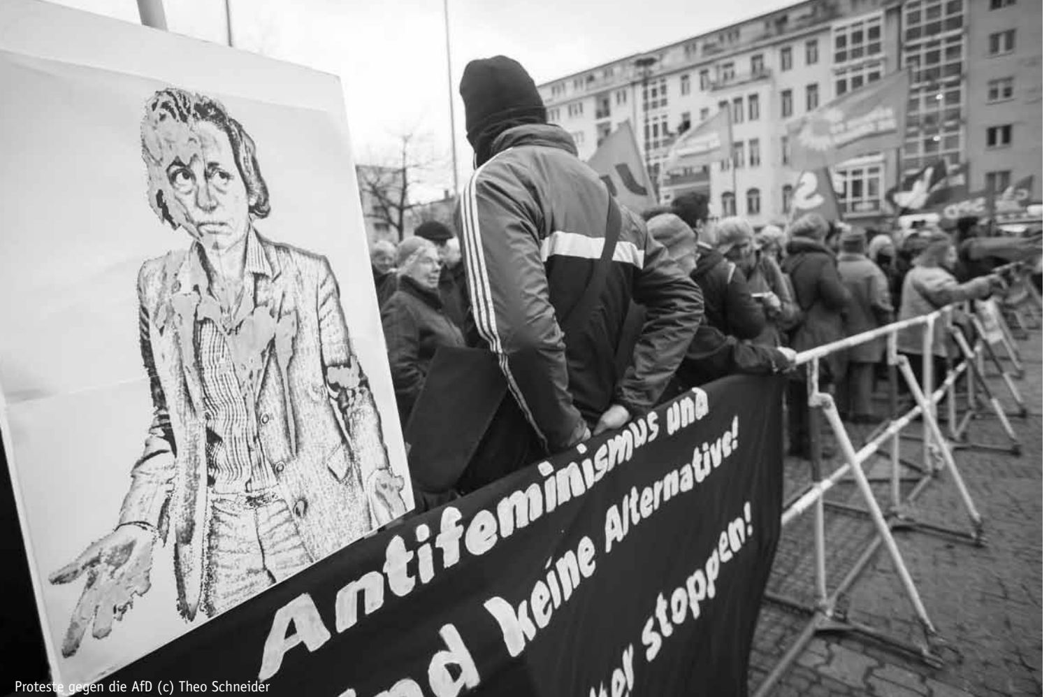
Proteste gegen die AfD

rechtspopulistische, rassistische und antidemokratische Positionen auch in allgemeiner Form problematisiert und widerlegt werden.