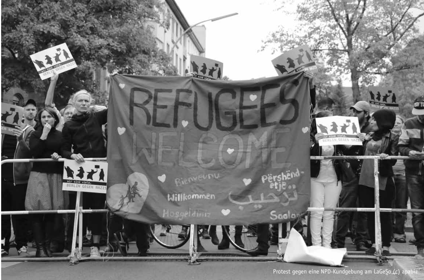
Protest gegen eine NPD-Kundgebung am LaGeSo.

wandernden oder Menschen mit Behinderungen.