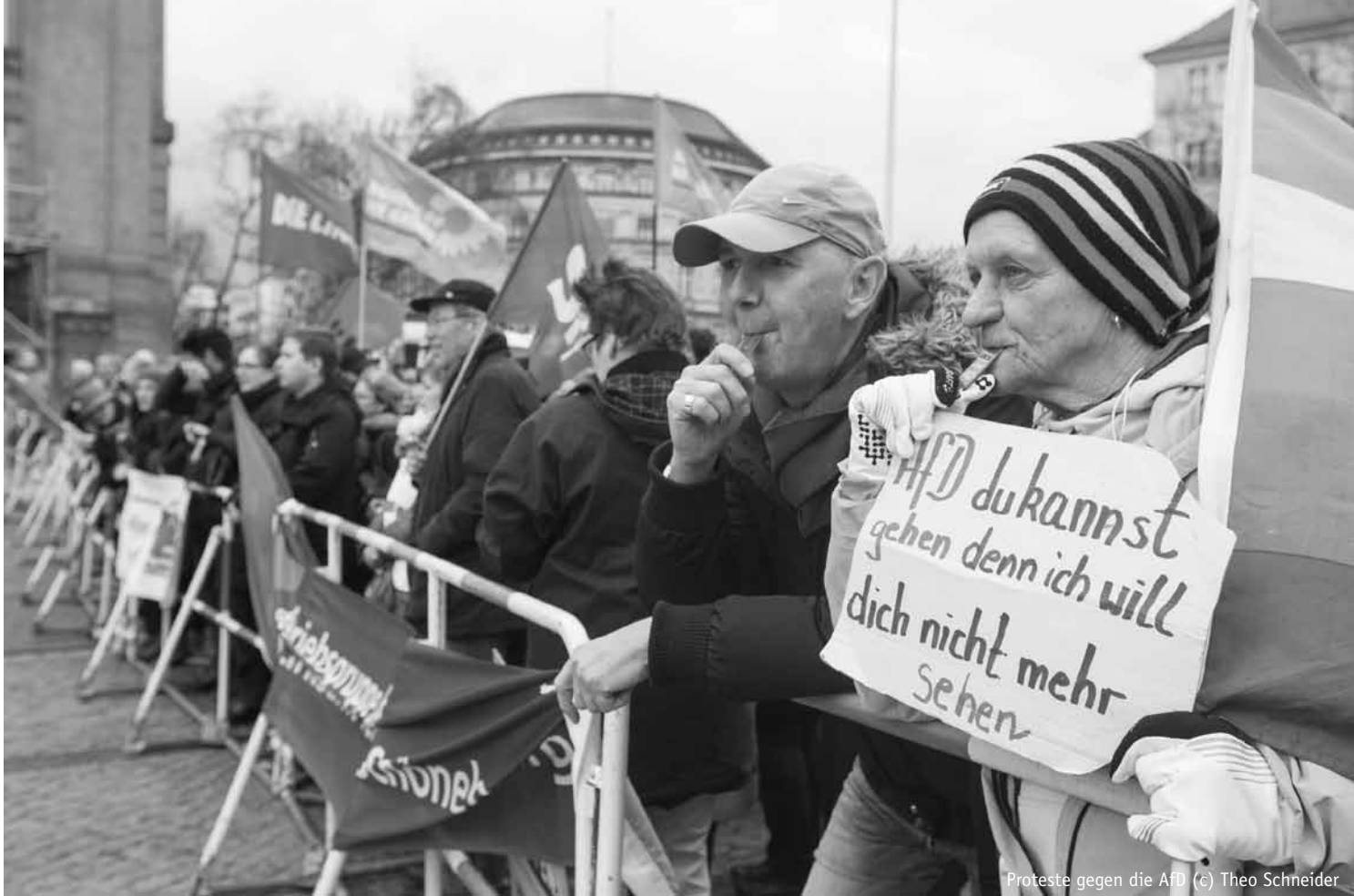
Proteste gegen die AfD

gedruckten Programme stattfinden sollte. Die Auseinandersetzung sollte eher die Äußerungen von Führungspersonen der AfD zur Grundlage machen, um die Programmatik von diesen Äußerungen her zu lesen und sie in die übergreifende Strategie der AfD einordnen zu können: einerseits das ständige Inszenieren von Tabubrüchen, das Verschieben der Grenzen des Sagbaren und ganzer Diskurse, andererseits Zurückrudern und Relativieren. Gleichwohl ist die genaue Kenntnis der Programme auf Bundes-, Landes- und Bezirksebene sowie aktueller Positionierungen z.B. in den sozialen Netzwerken der Kandidat_innen für eine Auseinandersetzung unabdingbar, gerade im Wahlkampf.