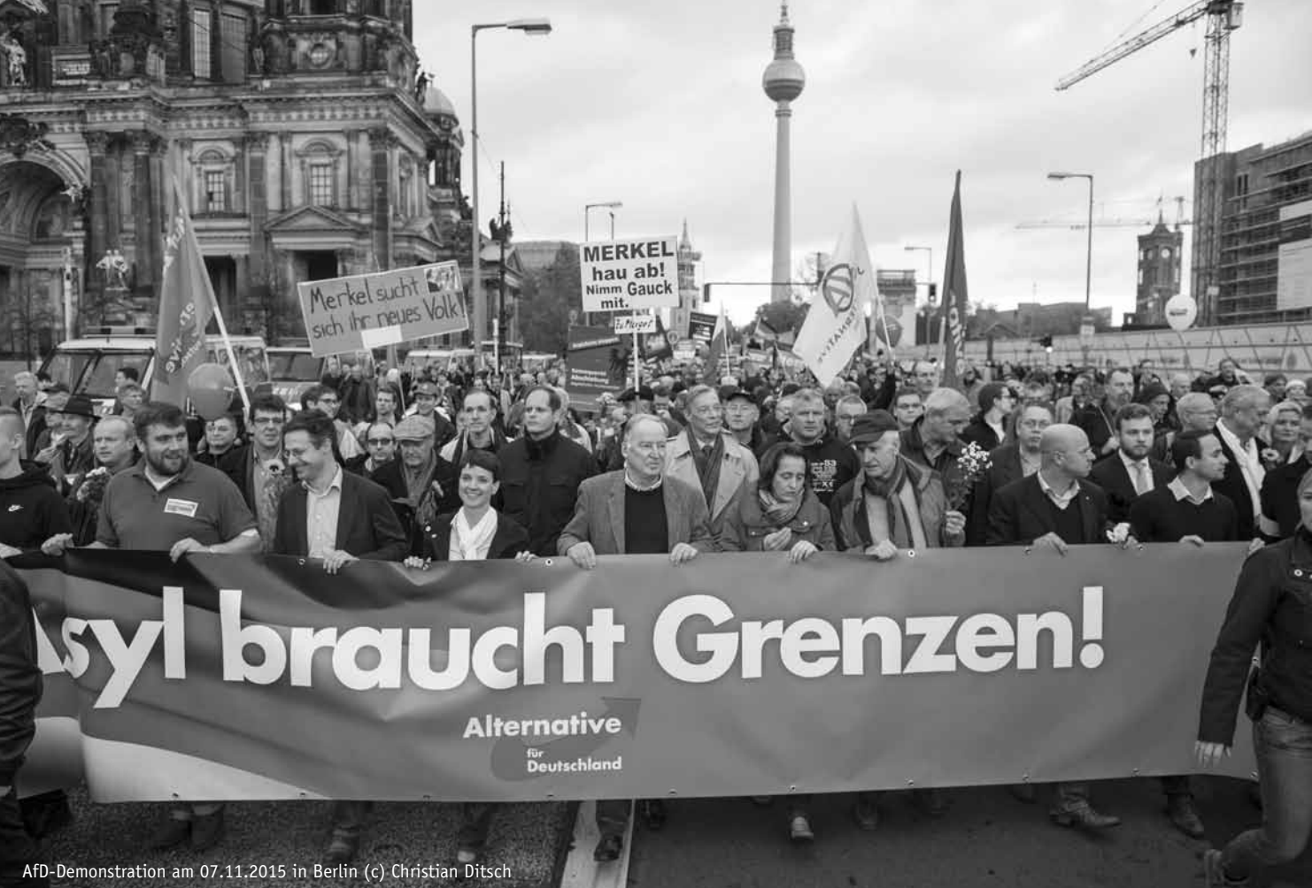
AfD-Demonstration am 07.11.2015 in Berlin