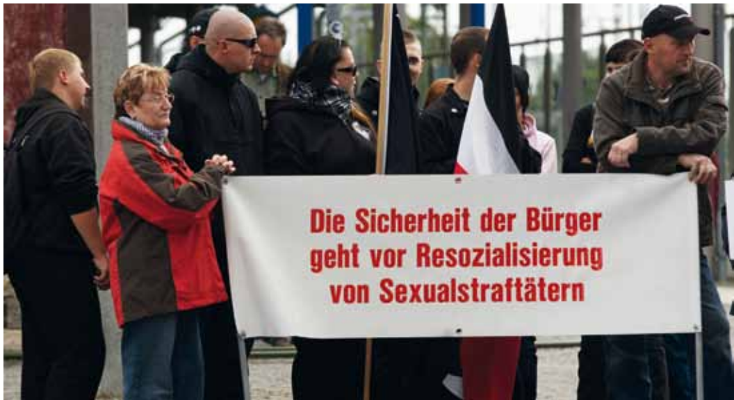
Stendal, September 2009: Neonazis und Bürger/innen demonstrieren gemeinsam gegen anässige Sexualstraftäter.

vor, untätig gegen Sexualstraftäter zu bleiben und spielen sich vor Ort als moralische Instanz und Ordnungsmacht auf, indem sie »Bürgerwehren« fordern oder »Bürgertelefon« für Informationen über bekannte Sexualstraftäter einrichten wollen. 19