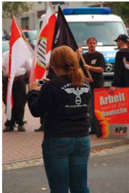
Teilnehmerin der NPD-Mahnwache in Joachimsthal im August 2009.