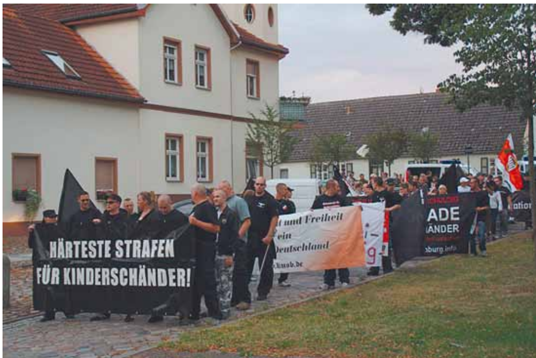
In Joachimsthal (Brandenburg) skandalisieren Neonazis in 2009 den Zuzug eines ehemaligen Sexualstraftäters.

Bei der Beantwortung solcher Fragen half ab Mai 2013 die Fachstelle »Gender und Rechtsextremismus« der Amadeu Antonio Stiftung. Sie unterstützte bei der Analyse der Situation und vermittelte Expertise zum Thema. Zudem wurden Vertreter/innen von Betroffenengruppen bei der Entwicklung eines demokratischen Leitbildes unterstützt – eine der zentralen Antworten auf die Versuche der Instrumentalisierung durch Neonazis. Dabei konnte die Stiftung auch an die Erfahrungen anknüpfen, die sie durch ihre Beratertätigkeit bei der Kirchengemeinde Joachimsthal in Brandenburg im Jahr 2008 sammeln konnte. Damals skandalisierten Neonazis den Zuzug eines ehemaligen Sexualstraftäters und erhielten breite Zustimmung von Bürger/innen. Die auf diese Herausforderung entwickelten Antworten wurden als Handreichung veröffentlicht, die sich an Zivilgesellschaft, Politiker/innen und Medien wendet.