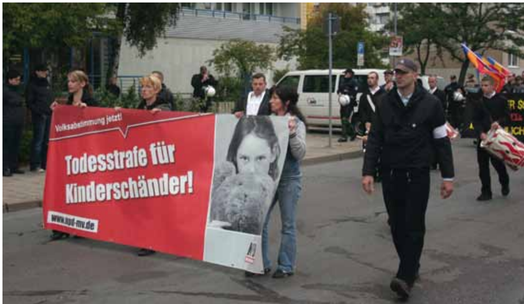
Neonazi-Demo in Schwerin 2010. Das Transparent zeugt von einer Missachtung rechtsstaatlicher Standards.

Rechtsextreme sprechen in ihren Kampagnen von »Kinderschändern«. Sie transportieren mit dieser Bezeichnung bestimmte Inhalte, die aus Perspektive demokratischer Standards und von Prävention äußerst problematisch sind. Das Wort ist im heutigen Alltagsverständnis nach wie vor weit verbreitet, häufig unhinterfragt. Neonazis können hier sehr erfolgreich anschließen. Ob es sich dabei um ein neues oder ein historisch wiederholt aufgegriffenes Phänomen handelt, ist im Folgenden Thema. Wir beschreiben zusammenfassend den Umgang mit Sexualstraftätern im Nationalsozialismus; für die Zeit nach 1945 fragen wir, wie rechte Gruppierungen auf die gesellschaftliche Liberalisierung von Sexualität reagieren. Diese geschichtlichen Betrachtungen sind äußerst hilfreich, um rechtsextreme Begrifflichkeiten als solche zu identifizieren und heutige Strategien der extremen Rechten zu erkennen. Hierfür ist es außerdem sinnvoll, den Umgang mit Sexualstraftätern im Nationalsozialismus, die Instrumentalisierung der Sexualität sowie die Reaktionen rechter Gruppierungen auf die gesellschaftliche Liberalisierung von Sexualität zu kennen. So lassen sich Kontinuitäten und Brüche im Agieren der Rechtsextremen aufzeigen. Nicht zuletzt zeigt sich, welche Ziele Nazis mit dem Aufgreifen des Themas verfolgen – damals und heute.