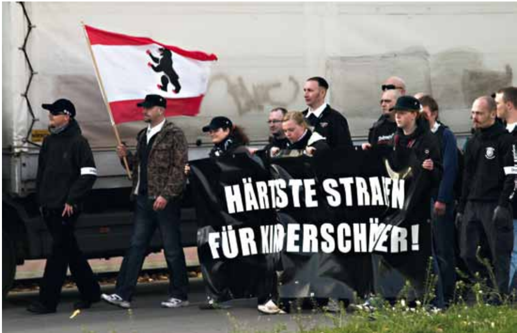
Neonazis demonstrieren unter dem Motto »Unsere Kinder – Gegen Kindesmisshandlung, Verwahrlosung unserer Kinder, Kinderschänder!« in Berlin, Marzahn-Hellersdorf, Oktober 2008.

Immer dann, wenn die Diskussion über den konkreten Fall hinausgeht und Forderungen nach »höchsten Strafen« oder der »Todesstrafe für Kinderschänder« gestellt werden, sollten Menschen und Initiativen hellhörig werden – dahinter stehen oft rechtsextreme Einstellungen. Das Agieren von Rechtsextremen zu erkennen und erfolgreich dagegen vorzugehen, setzt ein vielfältiges Wissen über die rechtsextreme Szene und deren Strategien voraus. Deshalb empfehlen wir in solchen Situationen, das Fachwissen von Mobilien Beratungsteams oder anderen Rechtsextremismus-Expert/innen einzubeziehen.