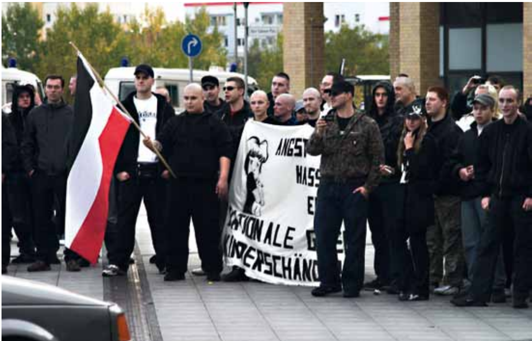
Rechtsextreme unter sich: In Berlin gelang eine Mobilisierung zum Thema Sexualstraftaten über die eigene Szene hinaus bisher nicht.